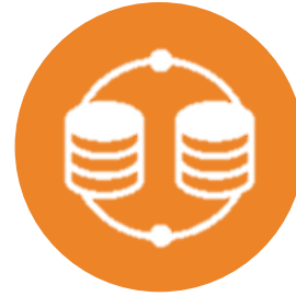
TALEND DATA INTEGRATION