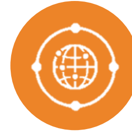
BIG DATA PLATFORM