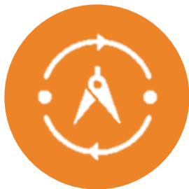
CLOUD API SERVICES