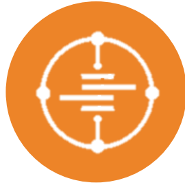
STITCH DATA LOADER