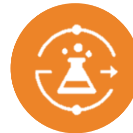
TALEND DATA PREPARATION