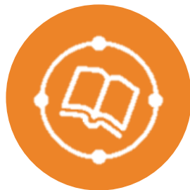
TALEND DATA CATALOG